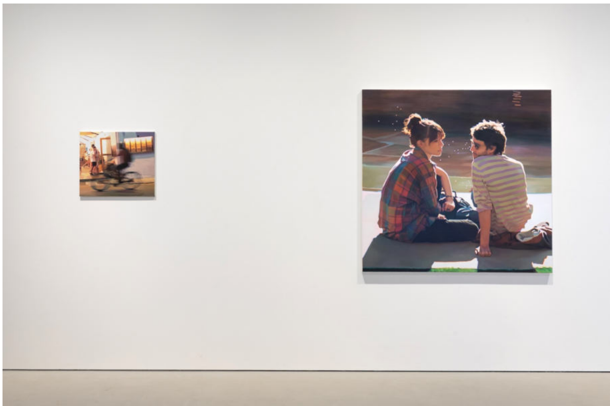
Ausstellungsansicht Galerie Wolfgang Jahn Landshut, 2023