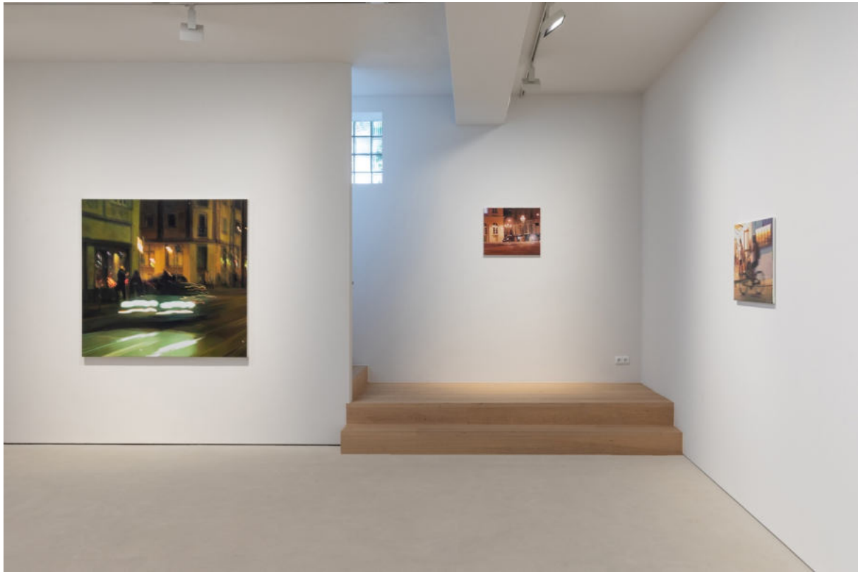
Ausstellungsansicht Galerie Wolfgang Jahn Landshut, 2023