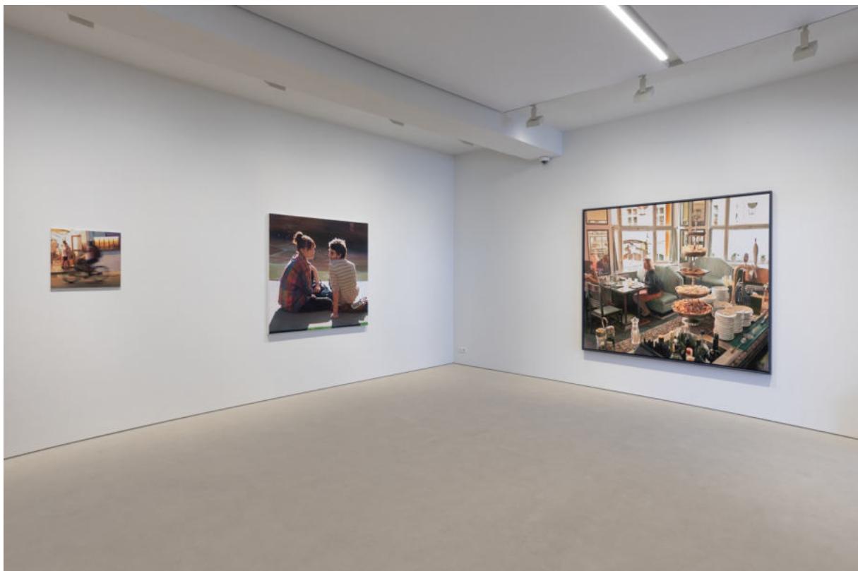
Ausstellungsansicht Galerie Wolfgang Jahn Landshut, 2023