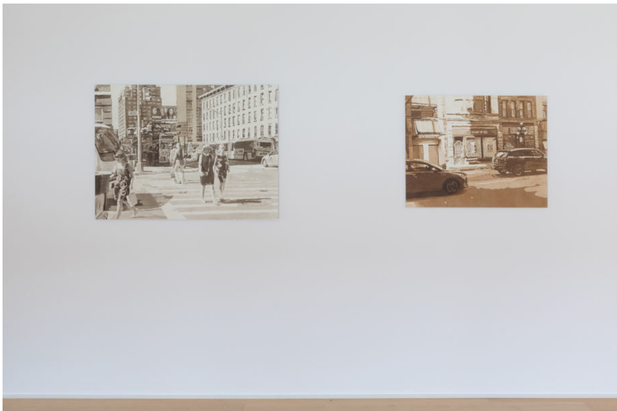
Ausstellungsansicht Galerie Wolfgang Jahn München, 2023