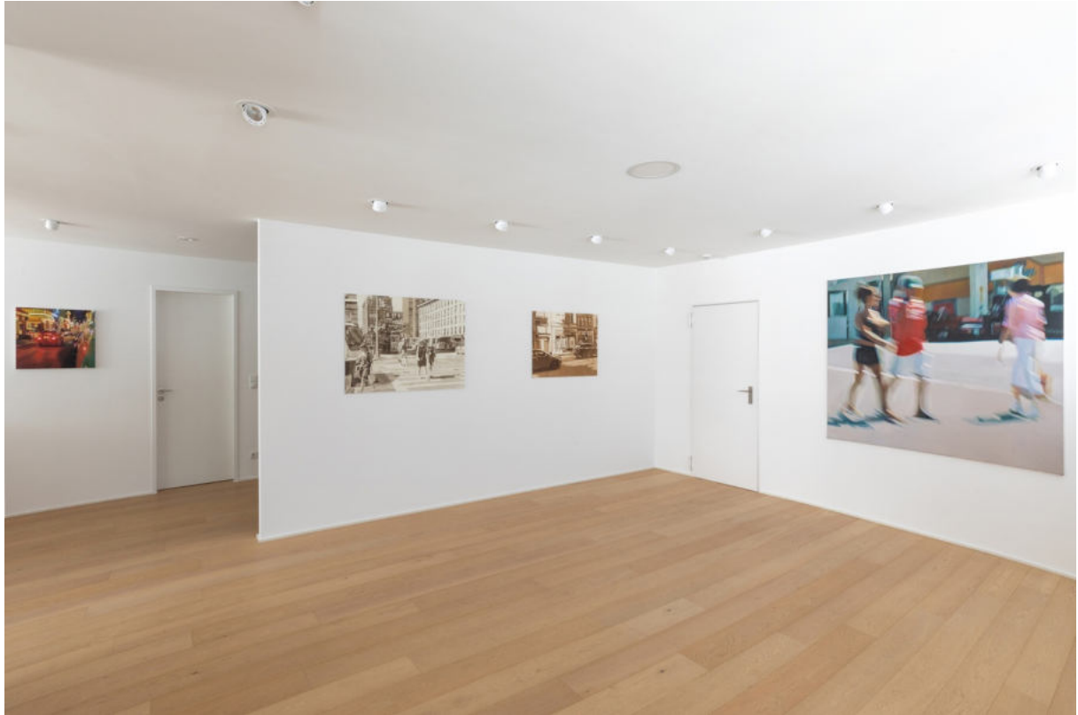
Ausstellungsansicht Galerie Wolfgang Jahn Landshut, 2023