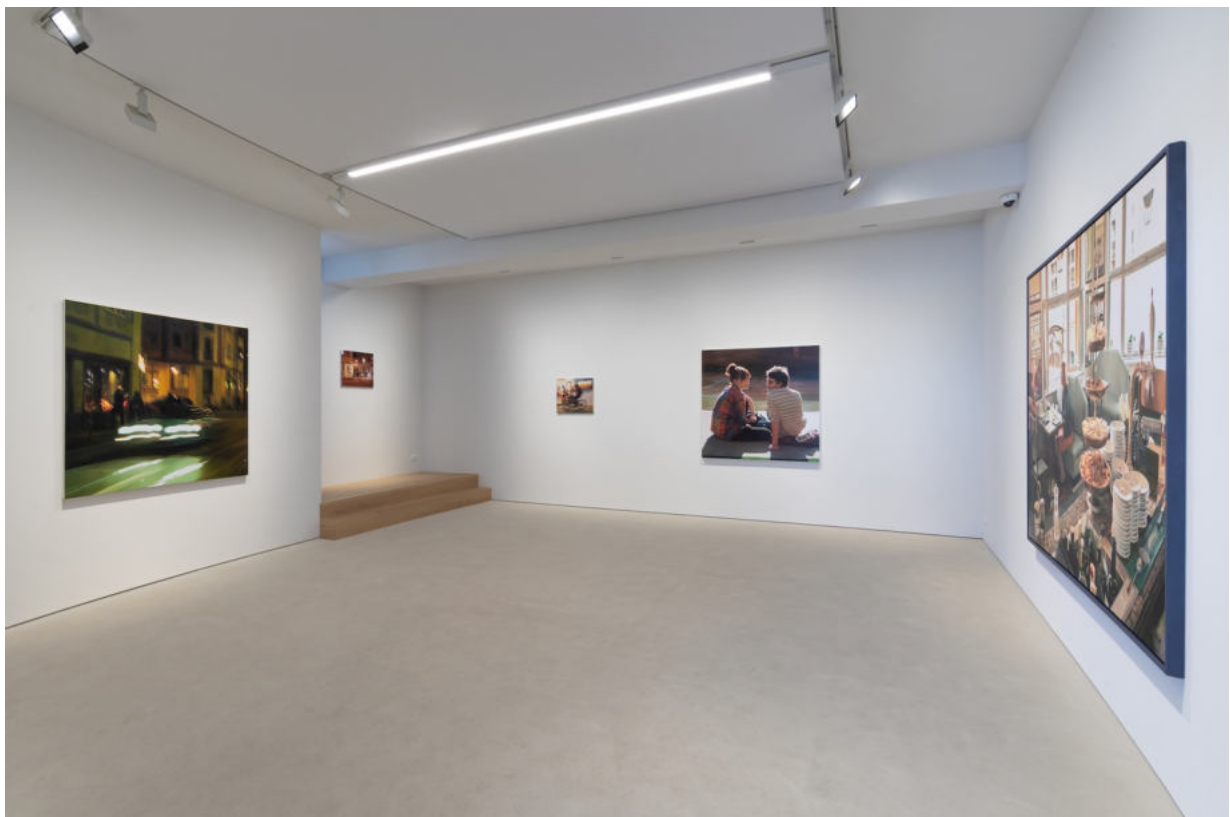
Ausstellungsansicht Galerie Wolfgang Jahn Landshut, 2023